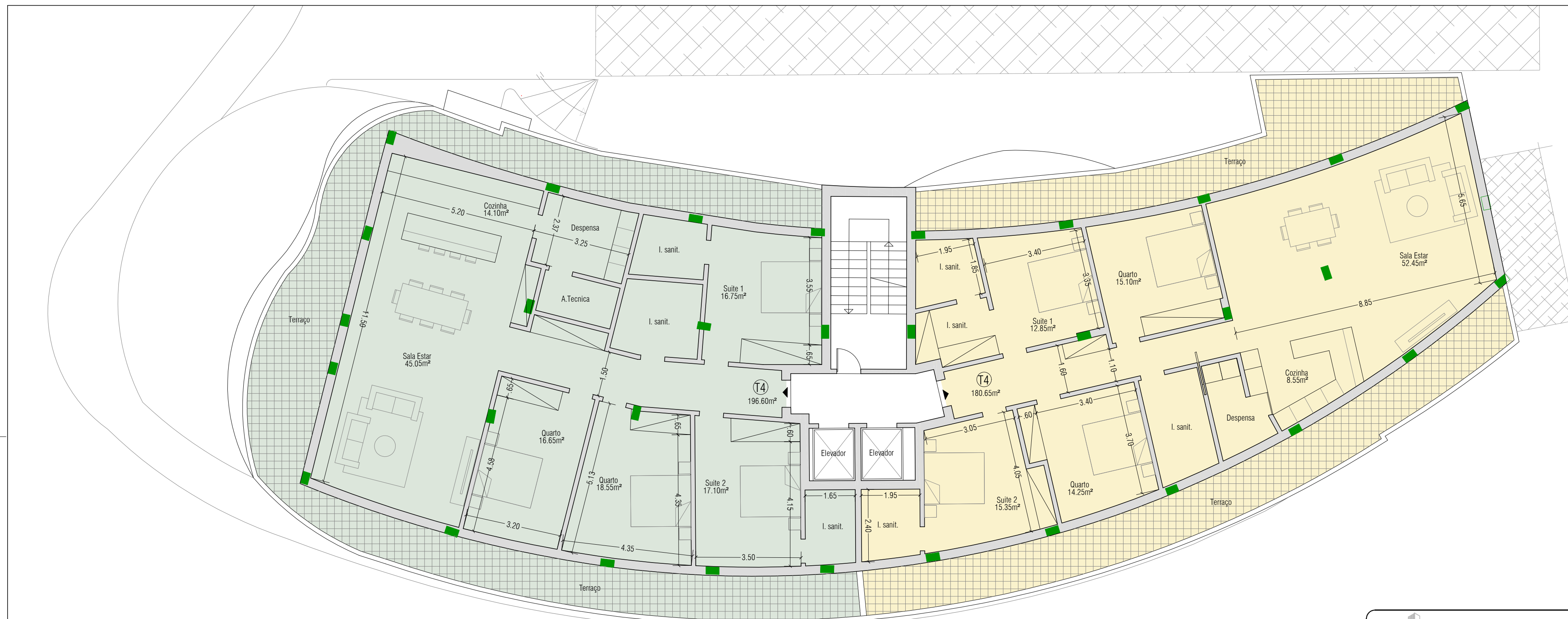
Planta do Piso 3